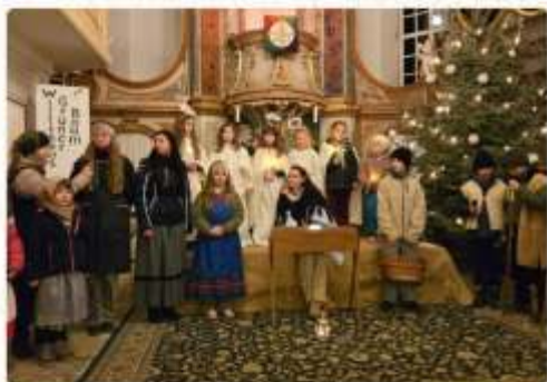
Krippenspiel in Frankenstein