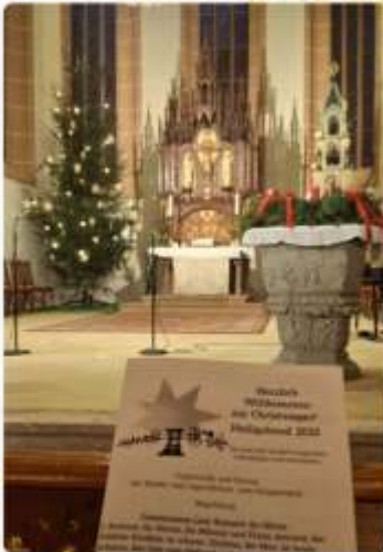
Christvesper in Oederan