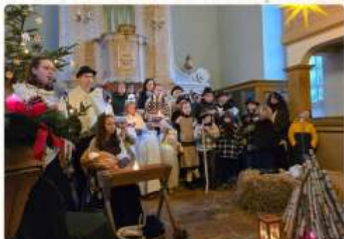
Krippenspiel in Kirchbach und Aufführung am 4.1.26 in Oederan