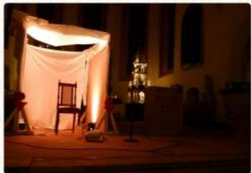
Christnacht in Oederan