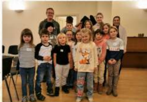
Krippenspielprobe in Frankenstein