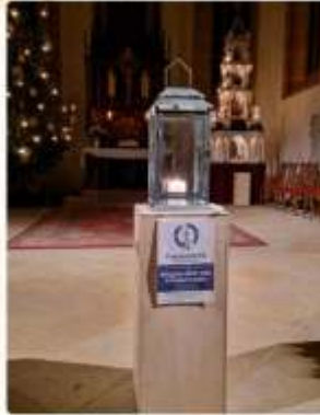
Andacht mit dem Friedenslicht von Bethlehem