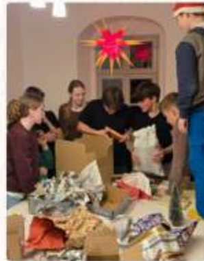
Konfis Kl. 7